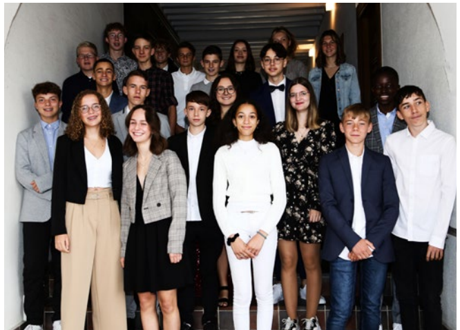
Sorens | Guillemette Colomb

Belle suite à tous les confirmés 2021 et à leurs familles